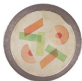
MISO SOUP 味噌汁