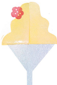
YUZU SOFT CREAM 柚子ソフトクリーム