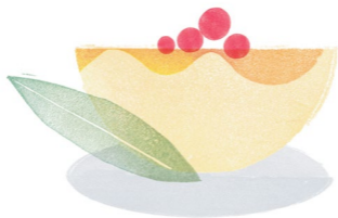
HOJICHA PANNACOTTA ほうじ茶 パンナコッタ