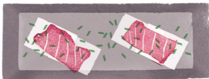
WAGYU NIGIRI 和牛サーロインの握り

Wagyu sirloin sushi (wasabi, ginger, salt)